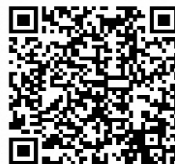
▲厚生労働省ホームページ