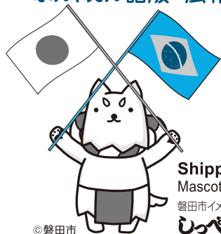
Shippei Mascote da cidade 磐田市イメージキャラクター しっぺい