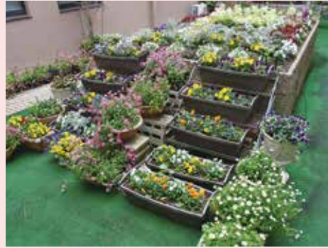
豊田一空園みどりの丘花の会