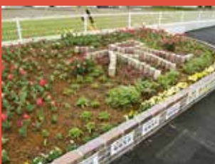
赤池自治会花の会