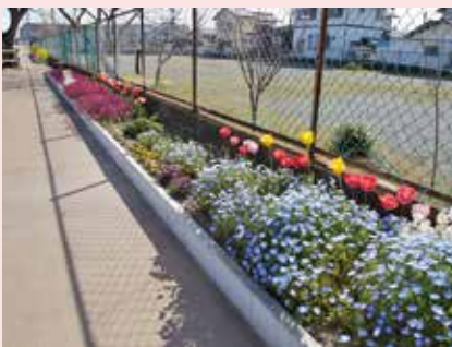
おおいずみ咲く咲く花の会