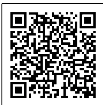
▲リチウムイオン電池発火実験

使用・充電方法を誤って出火する場合や、落下などの強い衝撃により出火場合があります。「充電の減りが速い」、「バッテリーが膨張している」、「充電中に熱くなる、変な臭いがする」などの異常がみられる時は、使用をやめて新しい電池に買い換えるか、メーカーや販売店に相談してください。