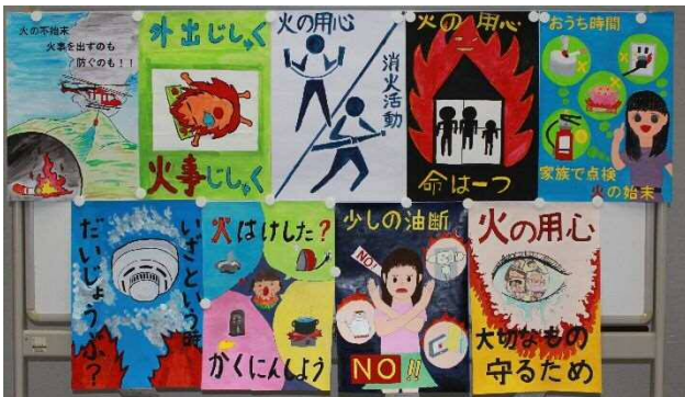
「少年の部 消防長賞 作品9点」