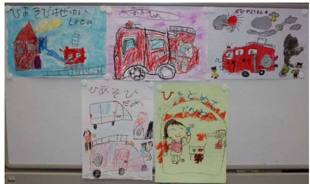
「幼年の部 消防長賞 作品5点」