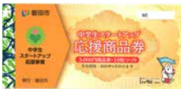
▲令和元年度商品券（参考）