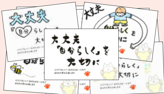
たくさんの直筆メッセージカードをお待ちしています