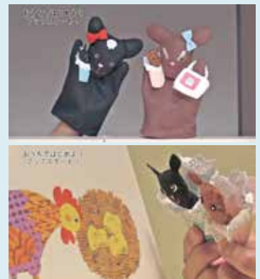
▲きなことあんこが説明します

制服だけでなく身の回りにある「も の」を、作った「ひと」に感謝し ながら大切に使いましょう。