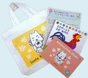
▲ブックスタートパックの例

今後の状況に合わせ、対象の子ど もたちに手渡しできるように、市ホ ムページなどで実施方法の変更など をお知らせします。詳しくは、市内 図書館または、にこっとにお問い合わせ ください。