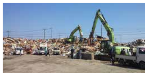
▲ごみ集積所と違う場所に設置される仮置場