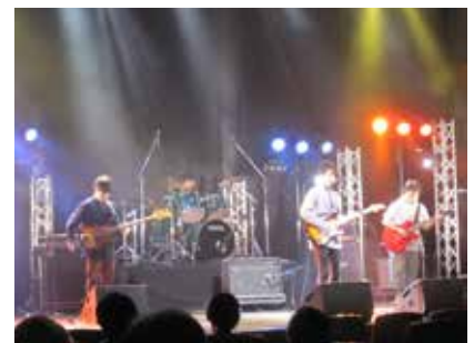
▲昨年のジャンルフリーコンサートの様子

「磐田フォークソング愛好会」がホストバンドとなり、懐かしの70年代フォーク・ソングをはじめとしたアコースティック・サウンドを奏でる地元アマチュア・シンガーたち13組が続々と登場します。