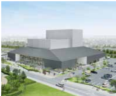
▲（仮称）磐田市文化会館イメージ図

※応募用紙は応募箱に備え付けています。また市ホームページからもダウンロードできます