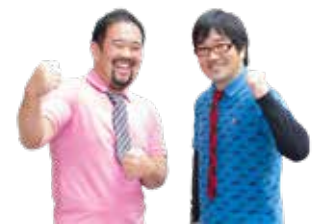
▲司会の「虎あげは。。」のお二人

主にロック・ポップスなど、地元アマチュア・ミュージシャンたち9組が自慢の演奏を披露します。今年も司会は、正統派しゃべくり漫才コンビの「虎あげは。。」が務めます。