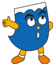
天竜川水系洪水ハザードマップより