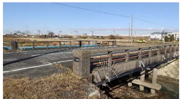
4.緊急輸送路における橋梁耐震補強 (工事予定の浮宮橋)