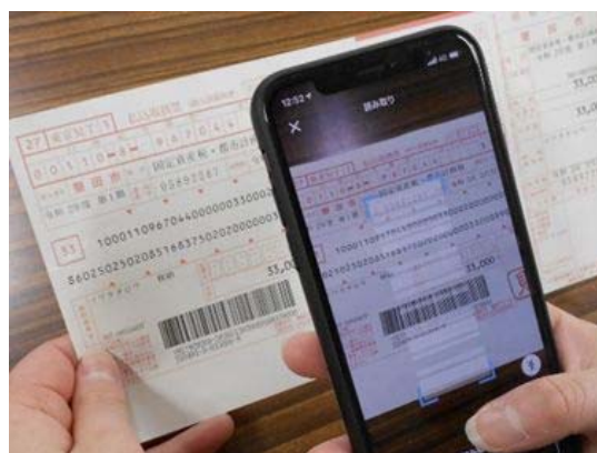
9.市税等収納におけるPay払い導入