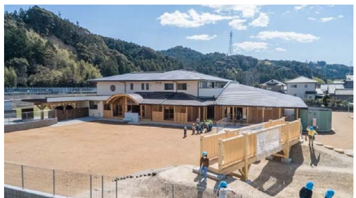
5.民間保育園施設整備への補助 (令和2年度に開園した広瀬こども園)