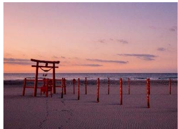
8.アニメーションを活用した観光PR (舞台となっている福田海岸)