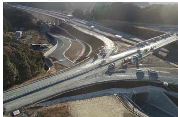
2. 新磐田スマートインターチェンジの完成・供用開始 (R3.1月現在の様子)