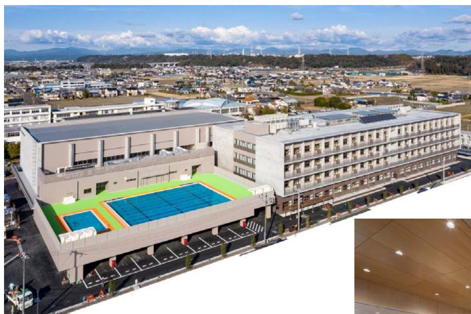
1.ながふじ学府小中一体校グラウンド等の整備 (写真は完成した校舎・ながふじホール)