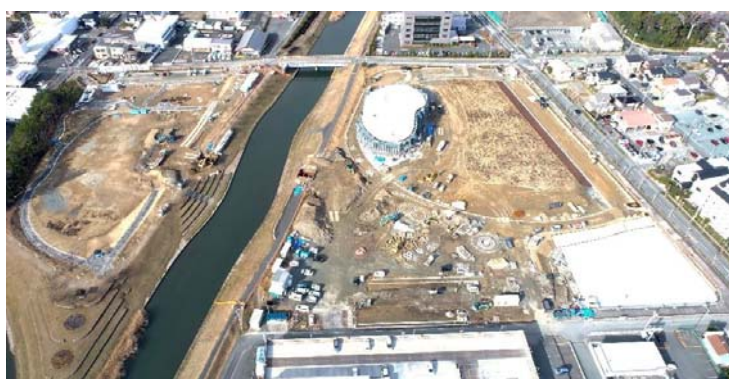
1. 今之浦公園・今之浦市有地の公園整備完了 (R3.1月現在の様子)