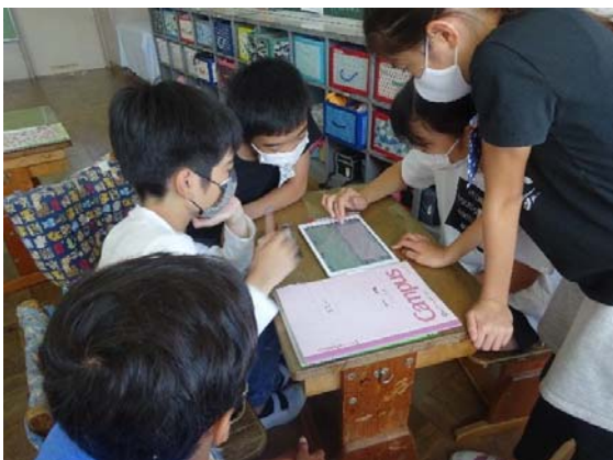
4.小中学生1人1台端末の導入による G I G Aスクール構想のスタート (タブレット端末を活用した授業の様子)