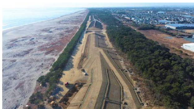
2. 海岸堤防の整備推進 (R3.1月現在の福田地区の整備状況)