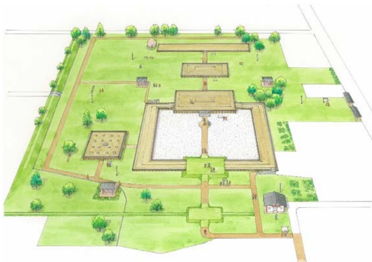
8.遠江国分寺跡公園整備工事の本格化 (整備イメージ)