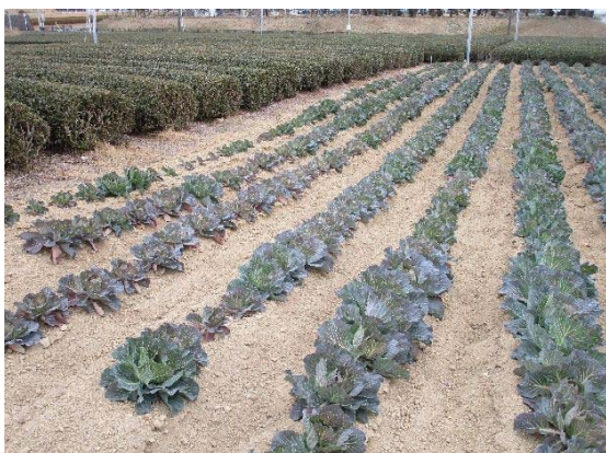
7.茶園から他作物への転換支援