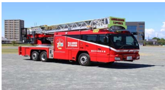
3.救急車の更新・はしご車のオーバーホール