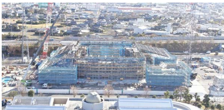
1. (仮称) 磐田市文化会館の整備推進 (R2.12月現在の様子)