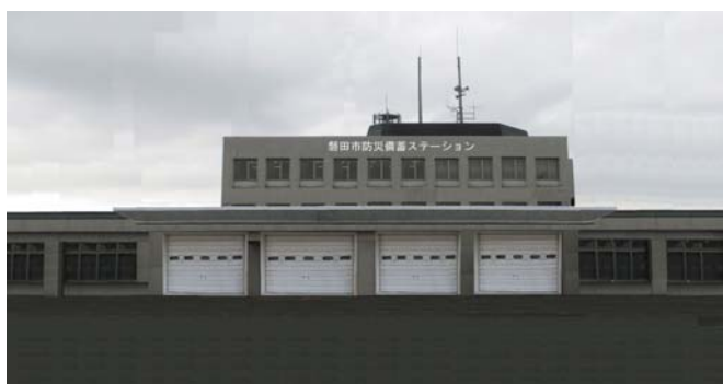
1. 防災備蓄ステーションの整備・完成 (改修後のイメージ)