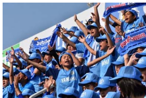
2. ジュビロ磐田のJ1復帰を支援し地域を元気に！ (ホームゲーム小学生一斉観戦の様子)