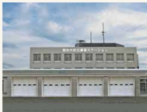
▲ 磐田市防災備蓄ステーション (イメージ)