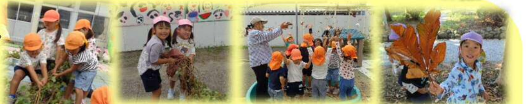
<さつまいも収穫体験> <落ち葉のシャワー楽しいね> <大きな葉っぱ見つけたよ！>

10月は園内外の自然に触れながら遊んでいる子どもたち。園外保育では気持ちが開放され、見たことや感じたことを言葉にする姿が多かったです。色づく葉、様々な木の実、バッタやトンボなど、実際に見て、触れて、感じて、匂いを嗅いで…五感が刺激されることで子どもたちの心が豊かに育っていきます。11月も園内外の自然に触れる直接体験の場を大切にしながら保育をすすめていきます。