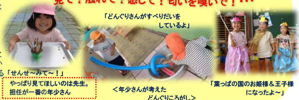
「どんぐりさんがすべりたいをしているよ」