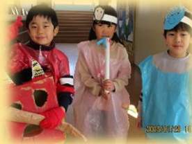
鬼と福の神の出張サービス！