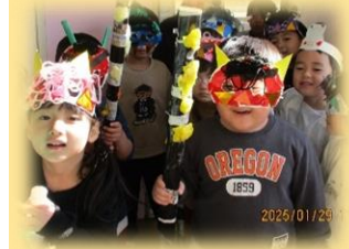
鬼がゾロゾロ、迫力満点！！