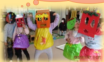
鬼の衣装も作っちゃった！