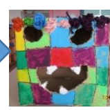
設計図を描いてから作ったよ！