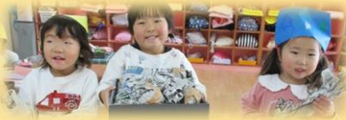
新聞で金棒や福豆をいっぱい作ったよ！

幼稚園にいろんな鬼が出現！福の神も加わって、節分ごっこがあちこちで盛り上がりました！