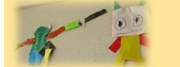
画用紙や色紙を折ったり、切ったり！