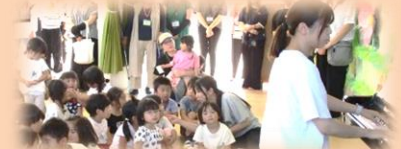
♪レット イット ゴー