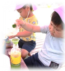
<研究者のような子供たち>

先日は、閉園に向けての思い出作りについて、アンケートにお答えいただき、ありがとうございました。いろいろなアイデアが寄せられ、とても嬉しかったです。家族みんなで考えてくださった方や閉園への思いを熱く伝えてくださった方もいました。みなさんのご意見を参考に、できる範囲で「みんなの心に残る」思い出作りに取り組んでいきます。具体的なことが決まりましたら、ご案内します。その際は、ご協力をお願いします。