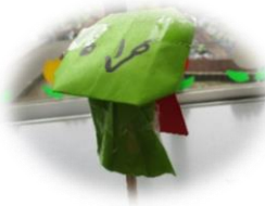
絵本に出てきたスーパーテテテマントが素敵！