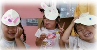
教師が切った形を組み合わせて作ったウサギやクマ、笑顔！