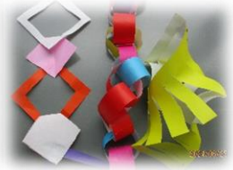
見て！いろいろな飾りがいっぱいできたよ！