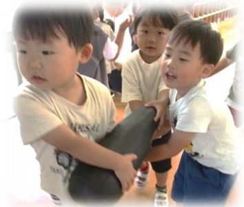
おばけズッキーニにびっくり！重～い！ (普通サイズ48本分)

もうすぐ七夕…絵本や紙芝居で七夕祭りが近付いていることを知り、七夕の飾り作りを楽しんでいます。作り方の見本を真似たり、教師や友達に教わったり、自分の考えをプラスしたり、オリジナルの飾りを作ったりと、いろいろな姿が見られます。七夕の星は、彦星がアルタイダ、織り姫がベガで、天の川を挟んで東と西に輝いています。2つの星は現実には17億光年も離れていますが、7月7日には、彦星と織り姫の再会を思い描きながら、子供たちのかわいい願いも込め、七夕祭りを楽しみたいと思います。晴れた日には、親子で星空を眺めてみるのもいいですね。