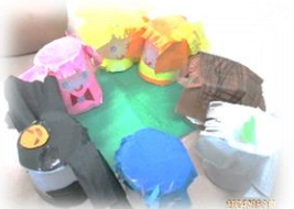
カップで園児を作ってピクニックにお出かけ！