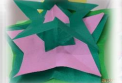
はさみを巧みに使って、星や天の川がこんなにきれいに完成！