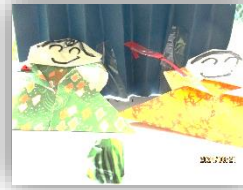
スイカ割りをする織り姫と彦星