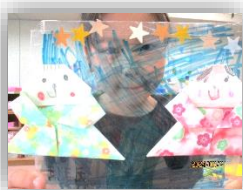
透明フィルムの夜空のもと、犬の織り姫と彦星が再会