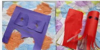
お化けだぞー！足がっぱいのタコ