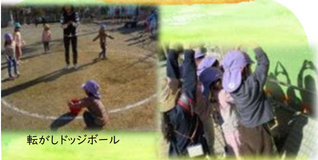
転がしドッジボール