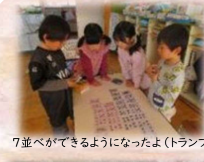
7並べができるようになったよ(トランプ)