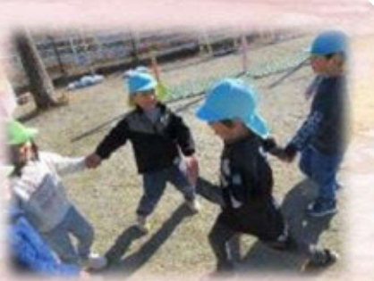
つかまえた!(鬼ごっこ)