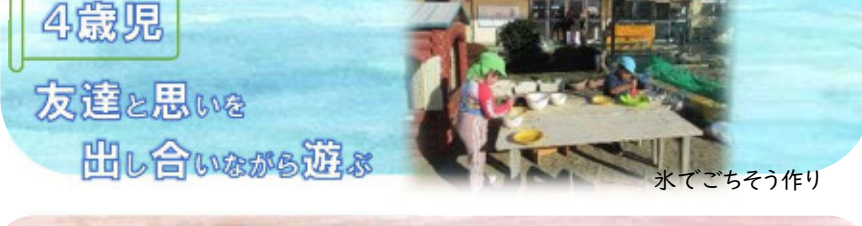
氷でごちそう作り