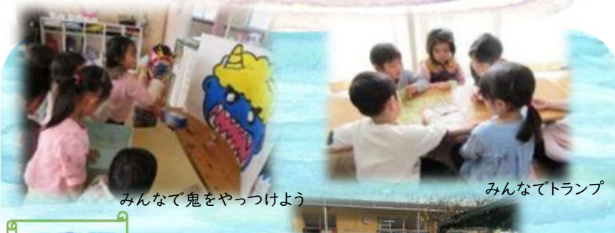
みんなで鬼をやっつけよう

地震から火事を想定しての訓練を消防署の方に見ていただき、5歳児と希望する4歳児、職員が地震の揺れを体験しました。子ども達は消防士さんの話を真剣に聞いて訓練に取り組みました。