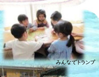
みんなでトランプ