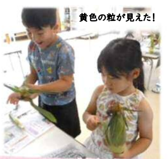
黄色の粒が見えた!