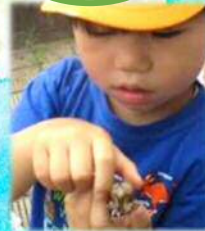
ちょっとこわいなあ…

「ミ〜ンミン!」「セミの声が聞こえた!」と子どもたちの嬉しそうな声。気温や時間に配慮しながらセミを探し。姿はなかなか見つかりませんが、抜け殻を発見!幼虫と成虫の姿の違いに気付いたり図鑑や絵本を見たり、興味関心が広がっていきました。