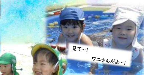
見て〜! ワニさんだよ〜!