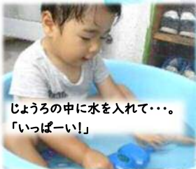
じょうろの中に水を入れて…。 「いっぱい!」

「きゃ〜!冷たい!!」「気持ちいい〜!」と大きな歓声と笑顔がいっぱいの水遊び。水に抵抗を感じる子もいますが、水に触れて遊ぶ中で、いつの間にか「水と仲良し!」に。 水の感触を味わい、冷たさや心地よさ などを感じています。