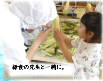
給食の先生と一緒に。

皮の匂いや手触り、モシャモシャなヒゲ、黄色くきれいに並んだ実の形など… 実際に経験することで得られる驚きと発見と興奮がいっぱい! でした。