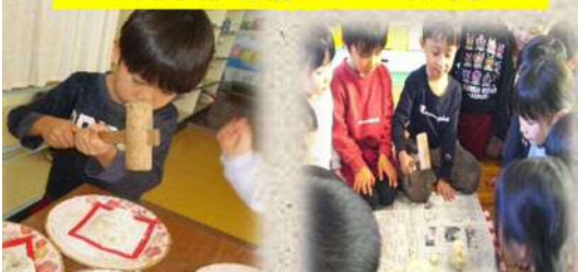
包丁（刃物）は縁起が悪いから木杵で割ることを知ったね