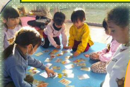
手作りカルタ遊び 友達の顔がカルタになっているので分かりやすい！