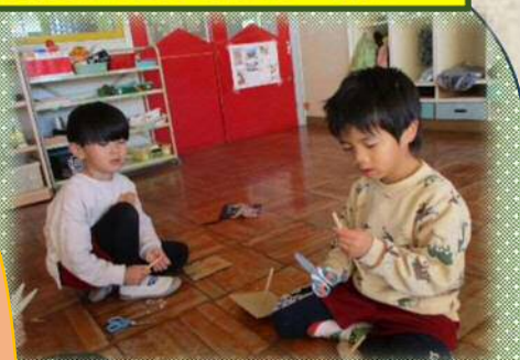
手作りこま作り こまの先をどうやってとがせたらよくまわるのかな？