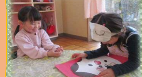
福笑い遊び 笑う門には福来たる 笑顔いっぱい！