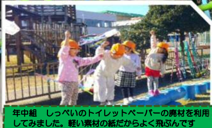
年中組 しっぺいのトイレトペーパーの廃材を利用してみました。軽い素材の紙だからよく飛ぶんです