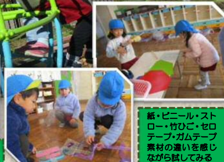
紙・ビニール・ストロー・竹ひご・セロテープ・ガムテープ 素材の違いを感じながら試してみる

「凧を高くあげたい 風のにせたい」という目的をもつことで、寒くても自然と身体を動かして「健康な体作り」に必要な遊びです