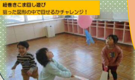
羽子板遊び 友達とのかかわりはもちろん、自分と羽根（風船）との距離感を調整する「定位能力」が身に付きます。