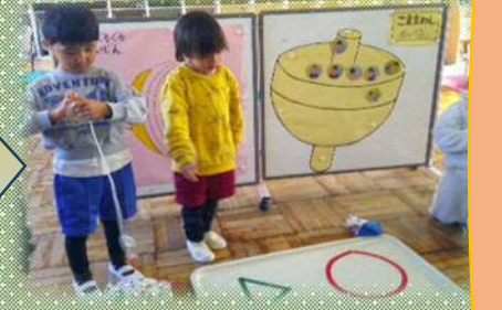
紐巻きこま回し遊び 狙った図形の中で回せるかチャレンジ！