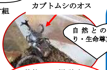
カブトムシのオス