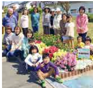
▲明ヶ島自治会 花の会の皆さん

保育園の子どもから仕事を引退された方まで、さまざまな世代が参加しています。植え付けは、子どもたちが一生懸命やってくれて、本当にうれしかったです。