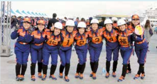
▲磐田市消防団女性隊

令和元年に開催された第24回全国女性消防操法大会では静岡県代表として出場しました。