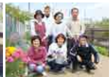
▲おおいずみ 咲く咲く花の会 の皆さん

大池の水路沿い約120mを8人で管理しています。受賞と聞いて驚きと喜びでいっぱいです。努力が報われました。今後は最優秀賞を目指したいです。