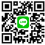
▲学生向け (新卒・既卒3年以内向け)

磐田市や県西部へ就職を希望する方に、就職イベント情報や就職活動に役立つ情報をLINEメッセージでお届けしています。まずは登録から！