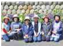
▲久保町万年青会 の皆さん

今回は、オリンピックをテーマに「静岡から世界へ、未来へ」をイメージしました。花を通じて、仲間と過ごす楽しい時間が何ものにも代えがたいです。