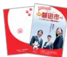
▲磐田市就職情報誌 (イメージ)

5/29(土)インターンシップフェアの参加特典(来場者限定)として、「磐田市就職情報誌」をプレゼント！(ページ番号:1009338)