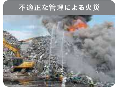
不適正な管理による火災

廃家電は電池やプラスチックを含むため、発火・延焼の危険性があり、不適正な管理による火災が発生しています。