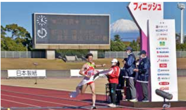
▲思いの詰まった襷をゴールまでつなぎました