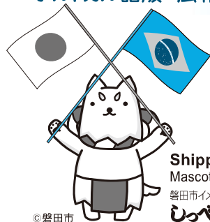
Shippei Mascote da cidade 磐田市イメージキャラクター しっぺい