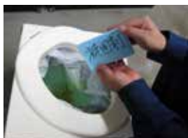
▶携帯トイレ（便袋）の使用イメージ