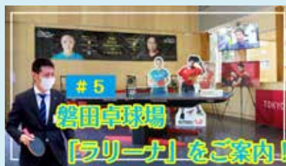
#5 磐田卓球場「ラリーナ」をご案内！ (2022年2月公開予定) 磐田市出身選手の顕彰エリアのある卓球場の利用方法を紹介

「今日はここから」が視聴できる磐田市公式YouTubeチャンネルは下記2次元バーコードから