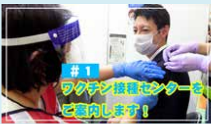
#1 ワクチン接種センターをご案内します！ (2021年6月公開) 新型コロナウイルスの大規模接種会場を案内