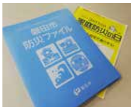
▶磐田市防災ファイルと配布チラシ

災害時のトイレ問題は、体調不良につながります。自宅で少しでも快適な避難生活を送れるよう携帯トイレを備蓄しましょう。携帯トイレは、市内ホームセンターなどで購入できます。