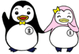
更生保護のキャラクター ホゴちゃん サラちゃん

法務大臣より委嘱を受けた保護司は、国の保護観察官と協働して、保護観察（犯罪を犯した人が更生を図るための処分）を受けている人の面接を行い、指導や助言をするほか、刑事施設や少年院に入っている人が出所（退院）後スムーズに社会生活を営めるよう、生活環境の調整や相談を行っています。