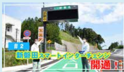
#2 新東名に開通したスマートICの入口から利用までの流れを紹介 (2021年7月公開)