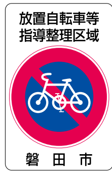
▲放置自転車等指導整理区域の標識

路上への駐車は景観を損ねるだけでなく、消火・救急活動などに支障を来します。また、目の不自由な方の通行の妨げとなり大変危険です。区域内に一定期間以上放置された自転車などは、市が撤去します。