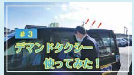
#3 デマンドタクシー使ってみた！ (2021年11月公開) デマンド型乗合タクシー「お助け号」の予約から利用までを紹介