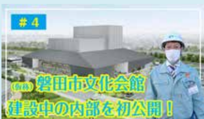
#4 建設中の内部を初公開！ (2021年12月公開) 建設中の磐田市民文化会館を視察。好評につき後編作成予定