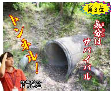
第3位 気分は サバイバル トンネル!