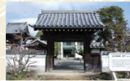
中泉御殿裏門 (西願寺)