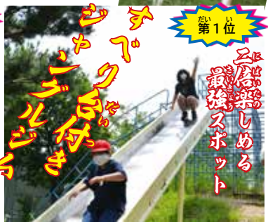
第1位 2人乗しめる 最後スポーツ

歴史や伝統があり、光栄に思っています。誕生日会は、しつぺいも一緒に、みんなで祝いできてうれしかったです。 校長先生