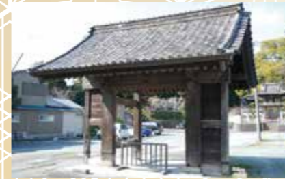
中泉御殿表門 (西光寺)