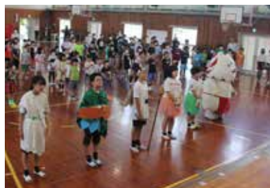
みんなで「150周年の絆」を歌ってお祝いしました

学校の未来を引き継げ！心かがやく袖浦の子。19日に150周年を迎えました。明治6年に海老島洋東小学校は、今年で150周年を迎えました。学校の誕生日である6月19日(月)から24日(土)までの1週間を150周年記念ウィークとして、特別なこと、特別なじゃないこと、いろいろなことに全校児童で取り組みました。地域の方にも協力してもらいながら迎えた150周年の主なイベントを紹介いたします。