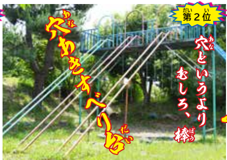
第2位 穴というより おしろ、棒