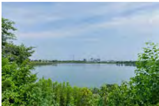
▲大池からJR磐田駅方面を望む

現在、干潟には多くの生物が集まり、とくに春と秋の渡りの時期には、多くのシギやチドリたちを見ることが出来ます。池の周りには、ウォーキングコースや野鳥観察施設も整備されているので、野鳥観察と散策を楽しむことができます。