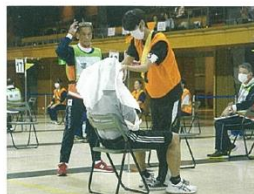
競技の採点をする奉仕団員

県支部は、水の事故からいのちを守るための知識と技術も県民のみなさまに伝えています! 本年度は、小中学校の児童・生徒を対象に「着衣泳」や「水に入らないレスキュー」の講習を県内40校約3,200人に実施しました。