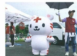
呼び込みを行う青年奉仕団員

イベントではたくさんの人と接することが出来るのでやりがいを感じています。これからも、赤十字活動を広めるため盛り上げていきます!