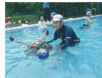
服を着たままでも浮く方法を伝える水上安全奉仕団員

私は水難事故のニュースを見て、事故を少しでも減らしたいという思いを抱いて、今年は14回の着衣泳講習に参加しました。今後も水の事故防止を多くの人に伝えられるよう活動を続けていきます。