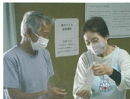
包装食袋の使い方を伝える地域奉仕団員

*包装食袋を使用することで、衛生的に調理ができ、お皿やスプーン等を使わずに食事が可能