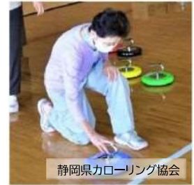
静岡県カローリング協会

子供から高齢者まで年齢、性別、体力に関係なく車椅子の方も気軽に参加できる楽しいコミュニケーションスポーツです。競技は、1チーム3人編成で5イニング40分間で1コート2チームが勝敗を競い合います。