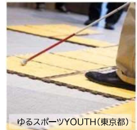
ゆるスポーツYOUTH(東京都)

目隠しをして、2種類の点字ブロックでできたコースをリレーする競技です。凸凹を感じ取って素早くゴールし、点字ブロックの奥深さを体感することができます。