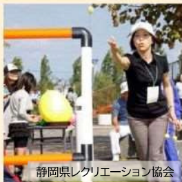
静岡県レクリエーション協会

ヒモでつながっている2個のボールをラダー(ハシゴ)に向かって投げ、ボールがラダーに引っ掛かると得点となります。投げたボールがラダーにハングすると、表示されている数字がポイントになります。