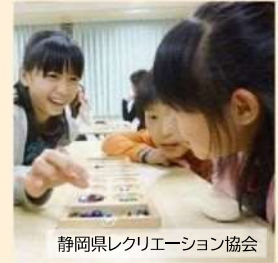
静岡県レクリエーション協会

アフリカや東南アジアで古くから遊ばれているゲームです。石を入れる穴が並んだボードの上で、自分の陣地の穴から石を早く無くした人が勝ちとなります。シンプルなゲームですが、頭を使う遊びです。