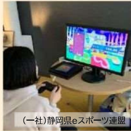
(一社)静岡県eスポーツ連盟

「エレクトロニック・スポーツ」の略で、電子機器(コンピューターゲーム、ビデオゲーム)を用いて行う競技全般を指します。アジア競技大会、国体文化種目などでも最近では競技として採用されています。