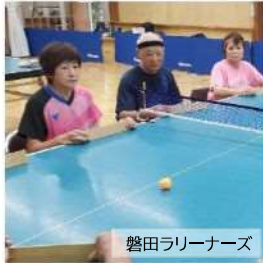
磐田ラリーナーズ

6人対6人で、椅子に座って卓球台を囲み、木の板で球を打ち、ネットの下から通過させて遊ぶスポーツです。球は転がすと音がなります。3打以内に、相手コートに返球し、得点を競い合います。