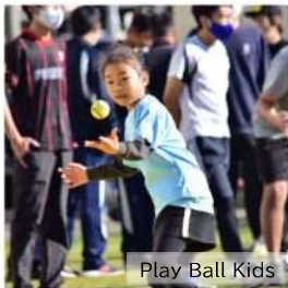
Play Ball Kids

ピッチャーがない、自分の手で打つ野球です。ボールが1つあれば「どこでも」「誰でも」気軽に楽しめます。自分の手で打つので、子供も大人も、初心者も経験者も、一緒に楽しくプレーできます。