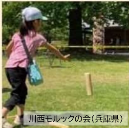
川西モルックの会(兵庫県)

フィンランド発祥のスポーツです。木の棒「モルック棒」を下から投げ数字が書いてあるピン(スキttl)を倒し、そして相手より早く50点びったりした人が勝利です。頭と体を使うスポーツです。