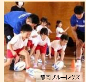
静岡ブルーレヴズ

「誰でも」「一緒に」楽しむことができることをコンセプトに、ラグビーの要素を取り入れた体験会となります。また、パラスポーツの体験会も実施予定です。