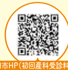
磐田市HP(初回産科受診料助成)

問合せ こども若者家庭センター 子育てサポートグループ TEL 0538-37-2012 FAX 0538-37-2812