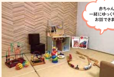
▲親子相談スペース