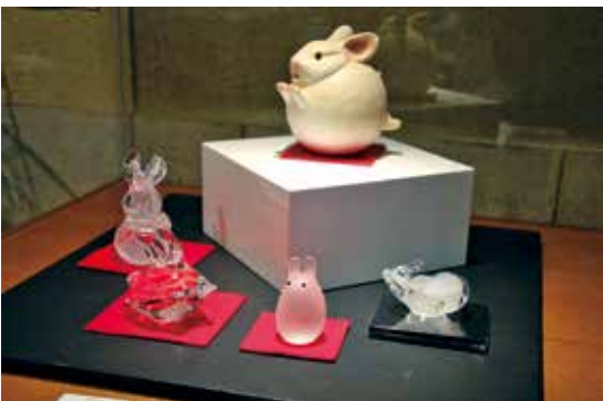
華やかでかわいらしいガラス作品が並びます