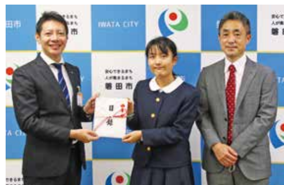
たくさんの思いが詰まった義援金を手渡しました

昨年9月23日に発生した台風15号による大規模な水害で被害を受けた方のため、磐田農業高校が校内で集めた義援金を、市に寄贈していただきました。