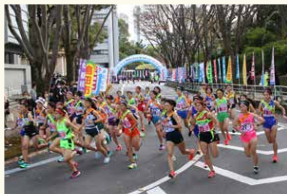
▲静岡県庁を一斉にスタート