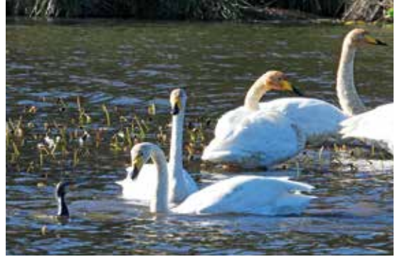
純白の羽をおさめ、優雅にたたずむオオハクチョウ

12月6日午前7時頃、鶴ヶ池で愛鳥家がハクチョウの成鳥6羽を発見し、くちばしの形や色からオオハクチョウと確認されました。