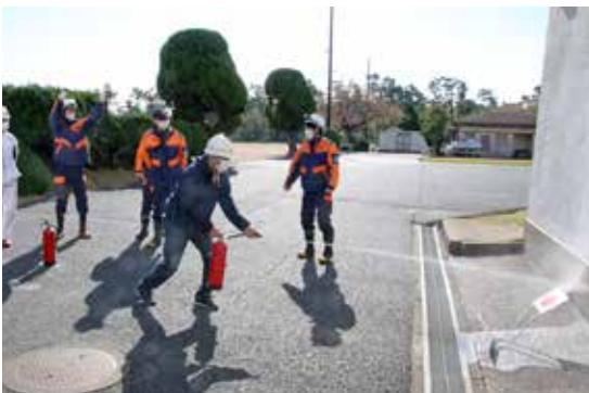
消火器を使った消火訓練を行う住民

地域住民が主体となり、地域防災力の向上を図る事を目的として、市内各避難所などで地域防災訓練が行われました。