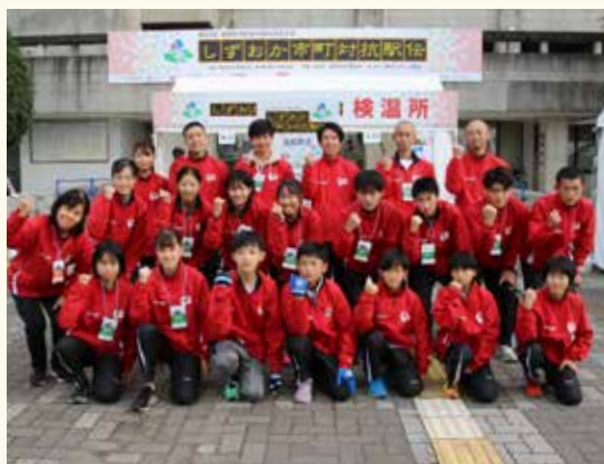
▲練習の成果を発揮しました