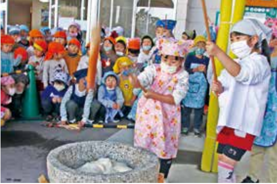
掛け声に合わせて、餅をつく園児たち

磐田なかよしこども園で、餅つき会が行われました。「餅つき」の由来を知り、使う道具や餅をつく様子を見て日本の伝統行事に親しみました。