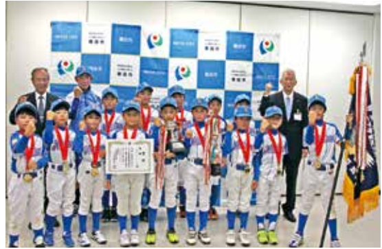
優勝旗を手に、喜びを報告する選手たち

第17回静岡ガス杯スーパージュニア学童軟式野球大会で初優勝を飾った「中泉クラブスポーツ少年団」が教育長を表敬訪問しました。