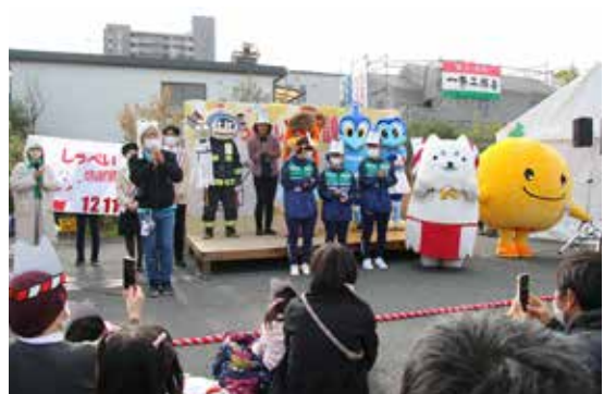
しっぺいとおともだちでにぎわうステージ

今回で48回目を迎える「みんなで軽トラ市 いわた☆駅前楽市」が行われ、ジュビロードには90台を越える軽トラックなどが並びました。