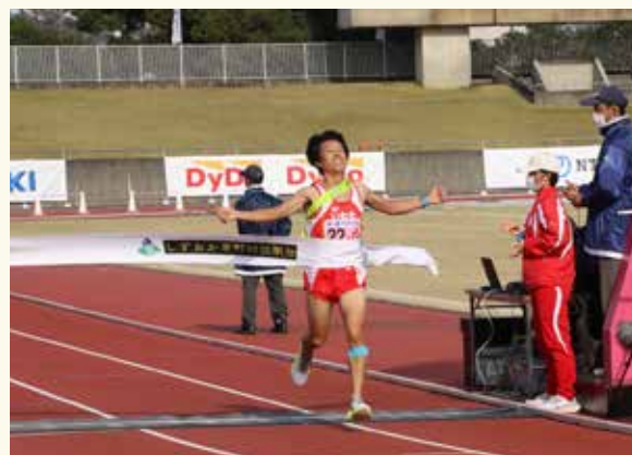
▲思いがこもった襷を胸にゴール