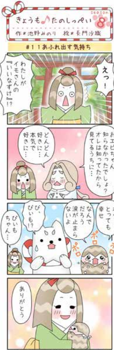
いいなずけて、どういこと!? つづく