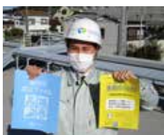
▲磐田市防災ファイルと全戸配布している黄色のチラシ

災害時は、断水や下水設備の破損で水洗トイレが使用できない場合があります。トイレを我慢することで体調を崩さないために、携帯トイレを備蓄しましょう。