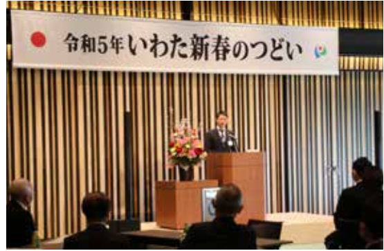
新年のあいさつをする草地市長

磐田市民文化会館「かたりあ」で、いわた新春のつどいが開催され、市内の経済団体やプロスポーツチームの代表など約40人が参加し、新年の抱負などを語り合いました。