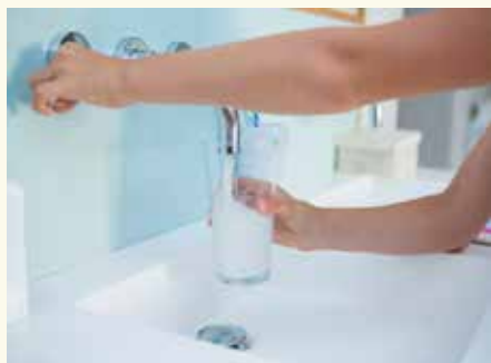
※今回の改定では、水道料金変更はありません

※改定率とは、使用料収入全体で13・9%の増収を目標としたもので一律に13・9%の値上げではありません