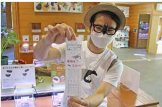
虫みくじをPRするこんちゅうクン

竜洋昆虫自然観察公園で、新年の運勢を占う園オリジナルの「虫みくじ」を来園者に配布しました。