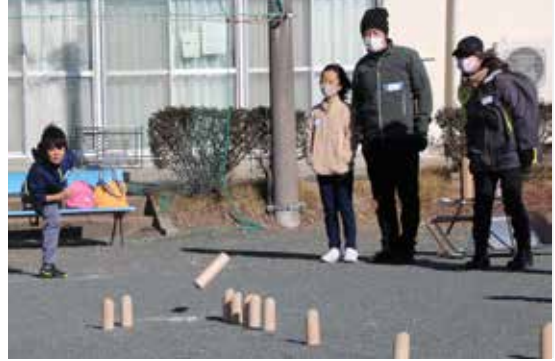
夢中で得点を競い合う参加者たち

御厨交流センターでフィンランド発祥のニュースポーツ「モルック」の体験会が行われ、小学3年生～70代の市民34人が参加しました。