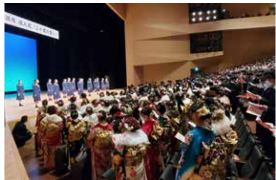
磐田市民文化会館に集う参加者たち

磐田市民文化会館「かたりあ」で二十歳の集いが開催され、1,263人の参加者たちが華々しい門出を迎えました。