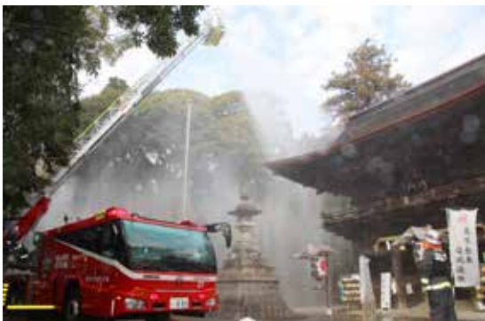
はしご車からの大量放水が行われました

毎年1月26日は「文化財防火デー」です。市内の文化財を守るための消防訓練が府八幡宮で実施されました。