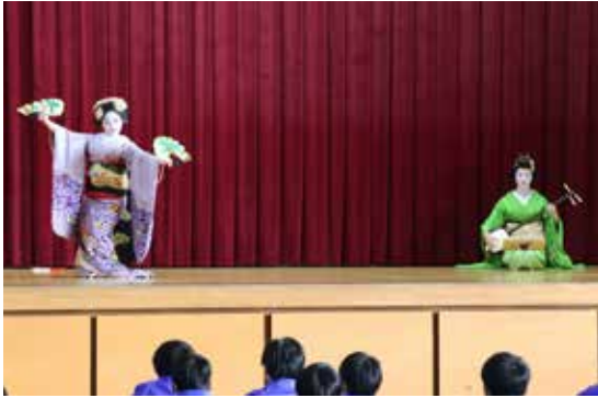
優雅で美しい踊りをする舞妓さん

福田中学校で、生徒たちに質の高い文化芸術に触れてもらうため、京都を象徴する「舞妓さん」と「芸妓さん」をお招きしました。