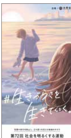
▲啓発リーフレット

市内では、7月の強化月間に保護司会・更生保護女性会を中心に啓発活動などが行われます。