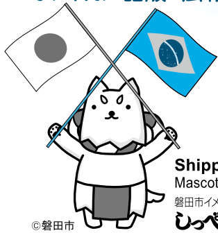
Shippei Mascote da cidade 磐田市イメージキャラクター しっぺい