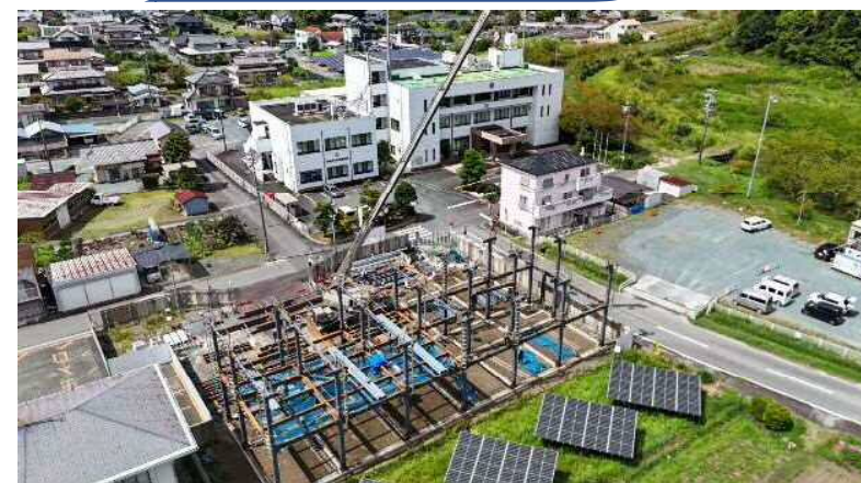
ドローン撮影 (南側より)