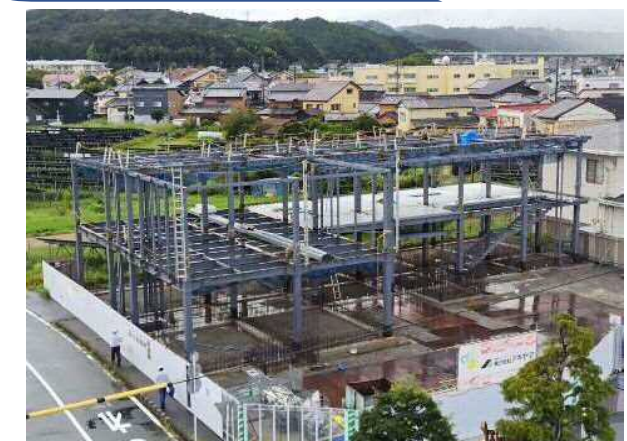
現庁舎屋上 (北側) から撮影