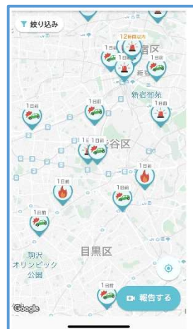
マップで災害等の発生 状況を把握