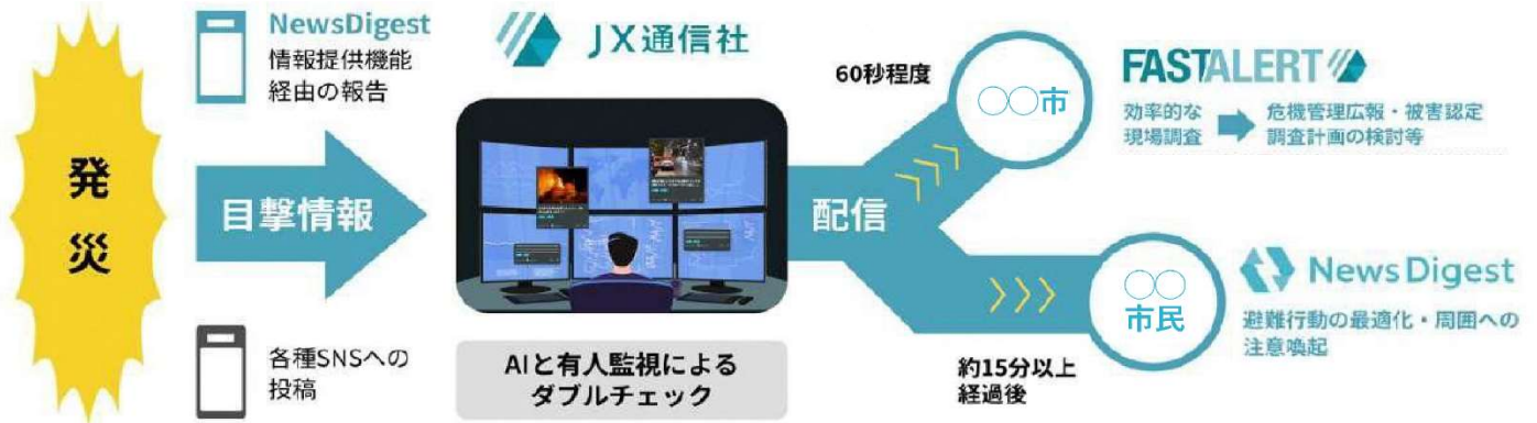
☒ NewsDigestを使った情報の提供～情報の確認までの流れ（災害時の場合）