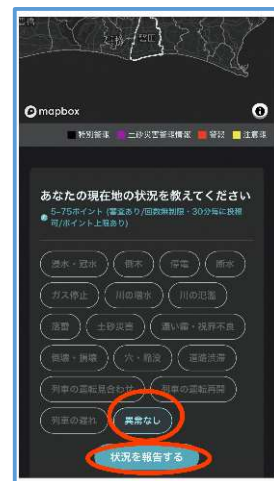
「異常なし」を選択し 「状況を報告する」