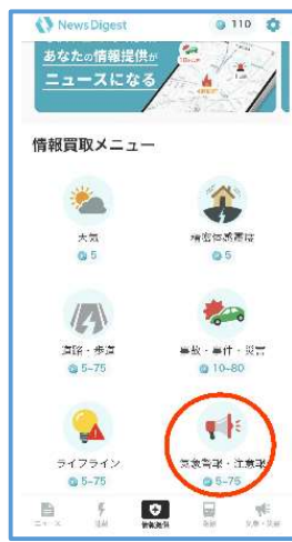
「気象警報・注意報」を選択