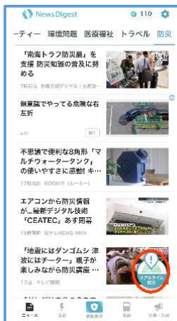
「リアルタイム防災」を選択