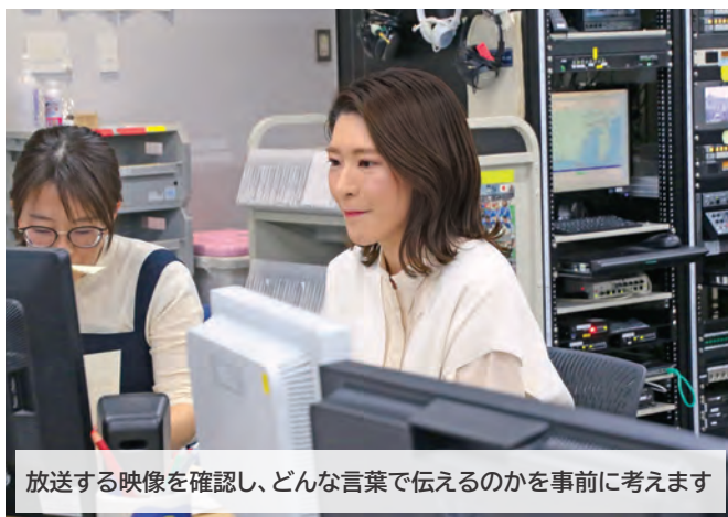
放送する映像を確認し、どんな言葉で伝えるのかを事前に考えます