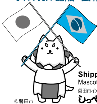
Shippei Mascote da cidade 磐田市イメージキャラクター しっぺい