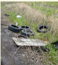
▲河川敷に捨てられたごみ