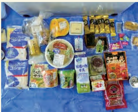
▲未使用・未開封のまま捨てられている食品

令和5年度「磐田市可燃ごみ内容物調査」によると、市内の家庭から排出される食品ロスの量は年間約2310トで、食べ残しや未開封・未使用のまま捨てられている食品が生ごみのうち約3割を占めています。