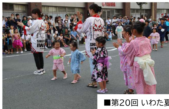
■第20回 いわた夏祭り in ジュビロード