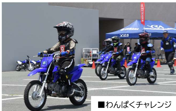
■わんぱくチャレンジ