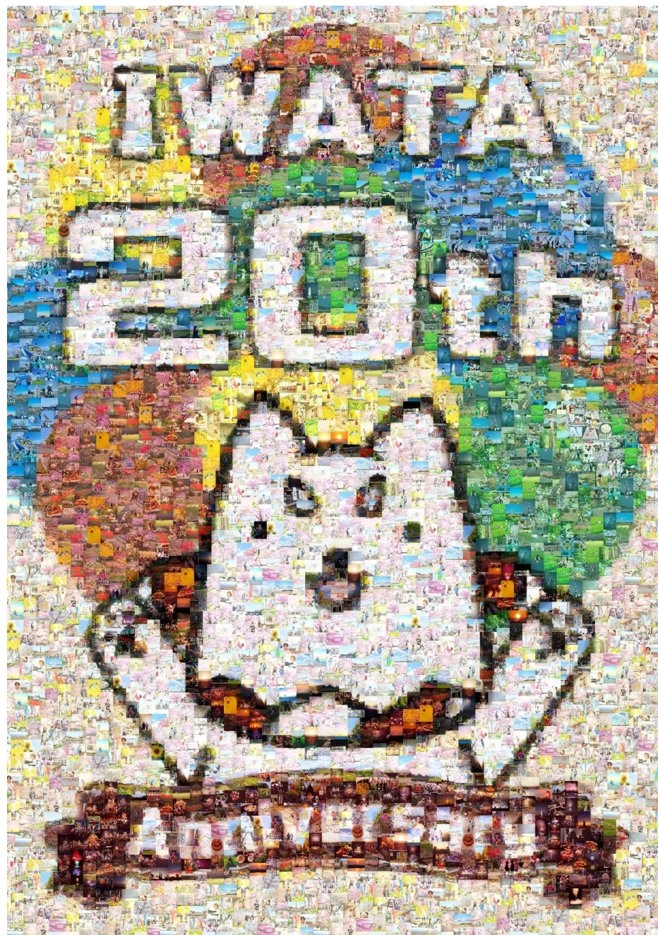
磐田っていいな♪ Instagram フォトコンテスト 2025 応募作品を利用したモザイクアート