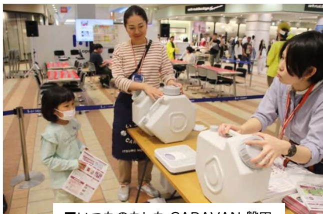
■いつものもしも CARAVAN 磐田