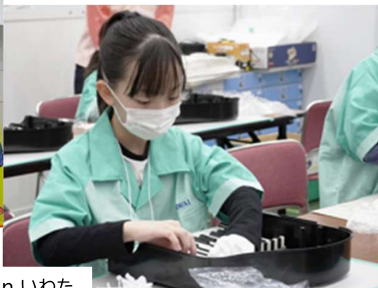
■Out of KidZania in いわた