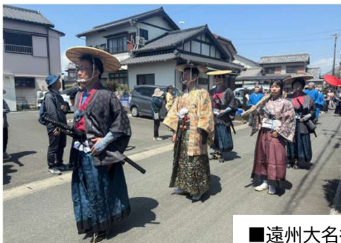
■遠州大名行列 舞車