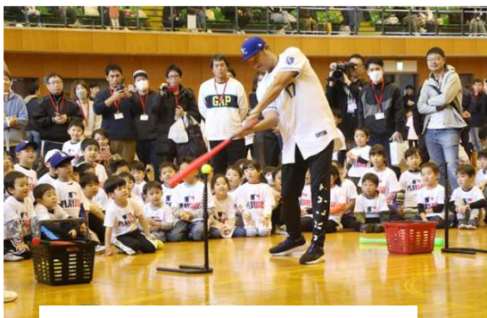
■MLB PLAY BALL in 磐田