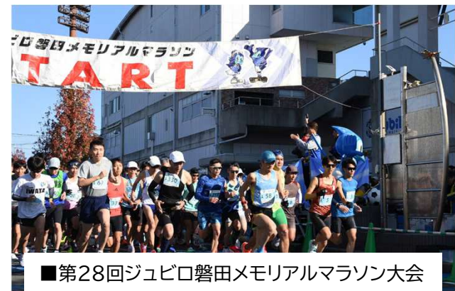
■第28回ジュビロ磐田メモリアルマラソン大会