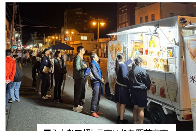
■みんなで軽トラ市いわた駅前夜市