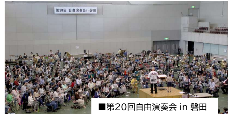
■第20回自由演奏会 in 磐田