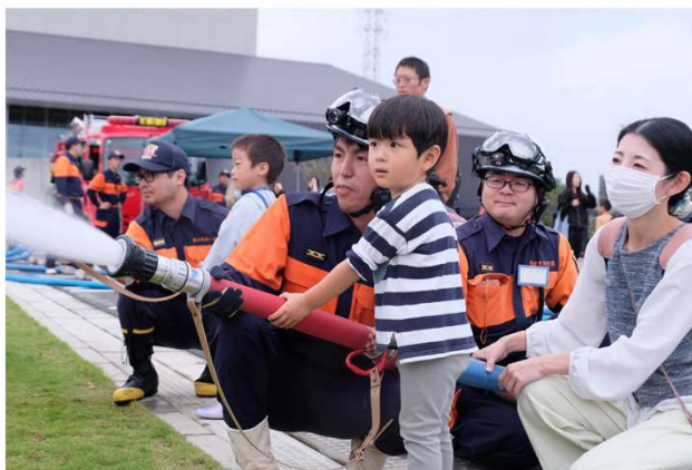
■いわたランドキッズデイ～市制20周年記念～