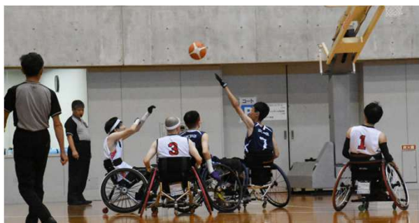
■第21回磐田市市長杯車いすツインバスケットボール大会