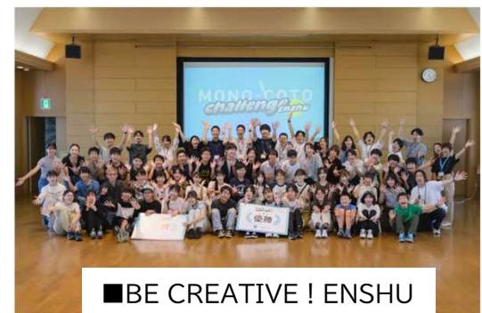
■BE CREATIVE! ENSHU