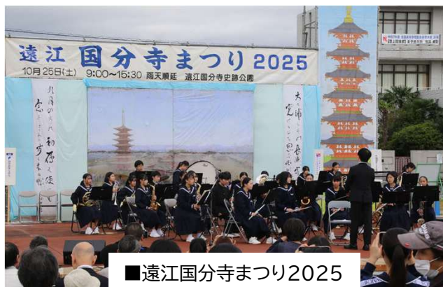
■遠江国分寺まつり2025