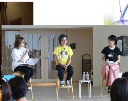
■よこただいすけ・かかずゆみ絵本の世界