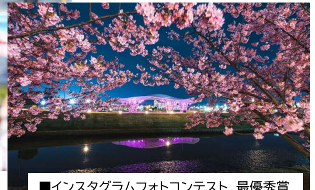
■Instagramフォトコンテスト 最優秀賞