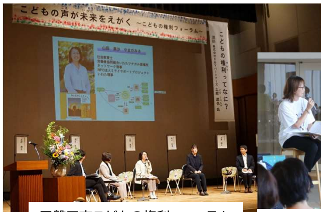
■磐田市こどもの権利フォーラム