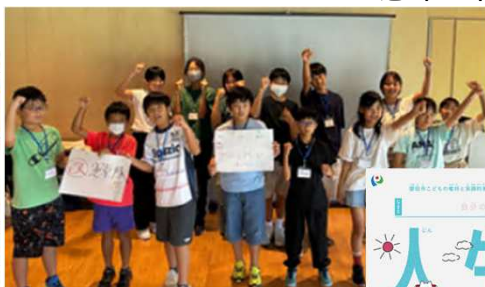
■こども・若者会議2025のメンバーが改訂