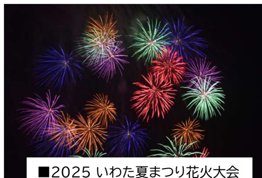
■2025 いわた夏まつり花火大会