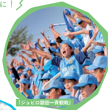
「ジュビロ磐田一斉観戦」