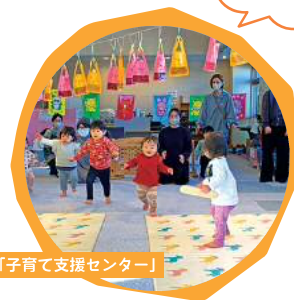
「子育て支援センター」