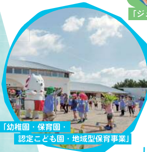
「幼稚園・保育園・ 認定こども園・地域型保育事業」