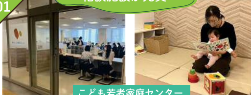
こども若者家庭センター