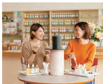
▲香りの体験コーナー