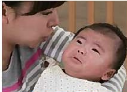
「シー」という音を聞かせる