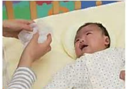
ビニールをクシャクシャさせる

その他に、ドライブに行くなど、心地 こち よい振動 しんどう で泣きやむこともあります。いろいろ試 ため してみましよう。 また、高熱 こうねつ が出ていたり、心配 いりょうき であれば、医療機関 いりょうき を受診 じゅしん しましょう。