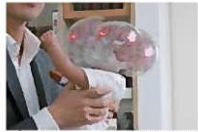
揺さぶりの危険性を伝える人形

赤ちゃんの泣き声に、ついイライラし、激しく揺さぶってしまう。 実際に激しい揺さぶりを目の当たりにした保健師の方に伺いました。