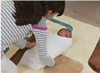
おくるみで包んであげる

次に、たとえば赤ちゃんがお母さんのお腹 なか の中にいたときの 状態 じょうたい を思い出させてあげましょう。